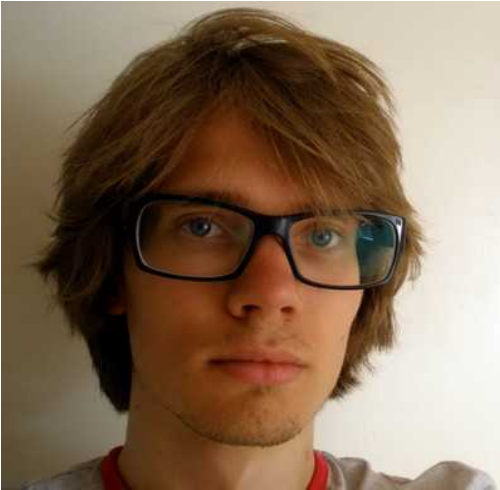
Composer: Bram Faber